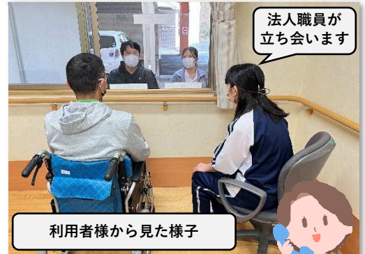
利用者様から見た様子