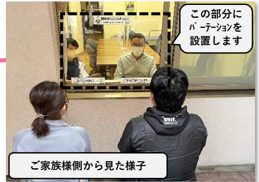
ご家族様側から見た様子